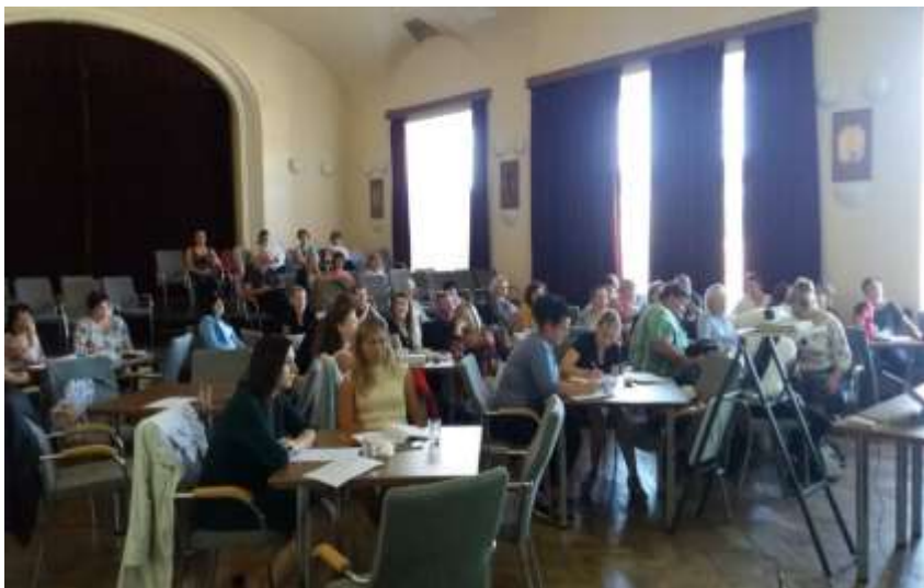
Školení pro nové zastupitele obcí